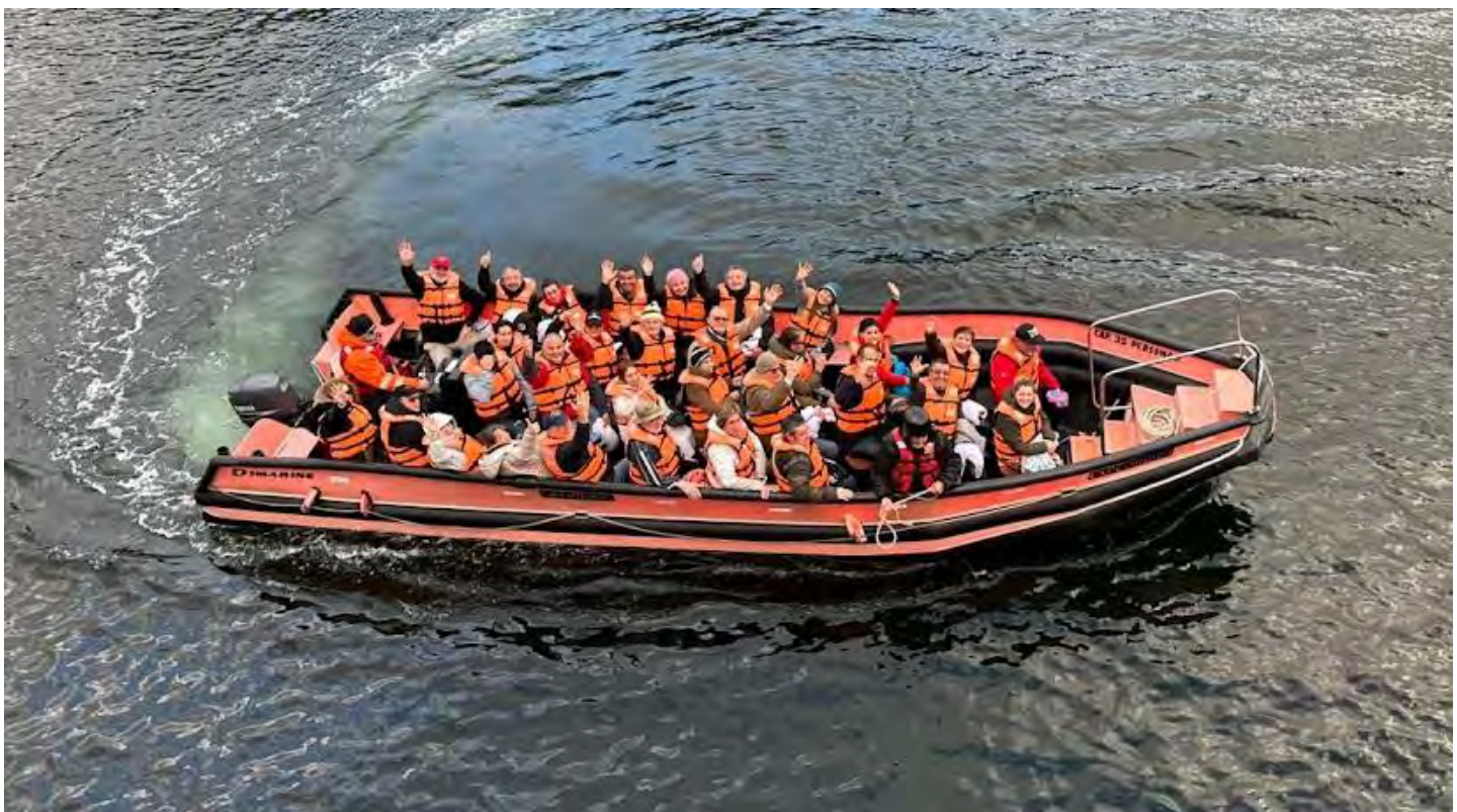
Un piquete a bordo de uno de los botes que se utilizaron para los diversos asaltos a las islas de Chiloé