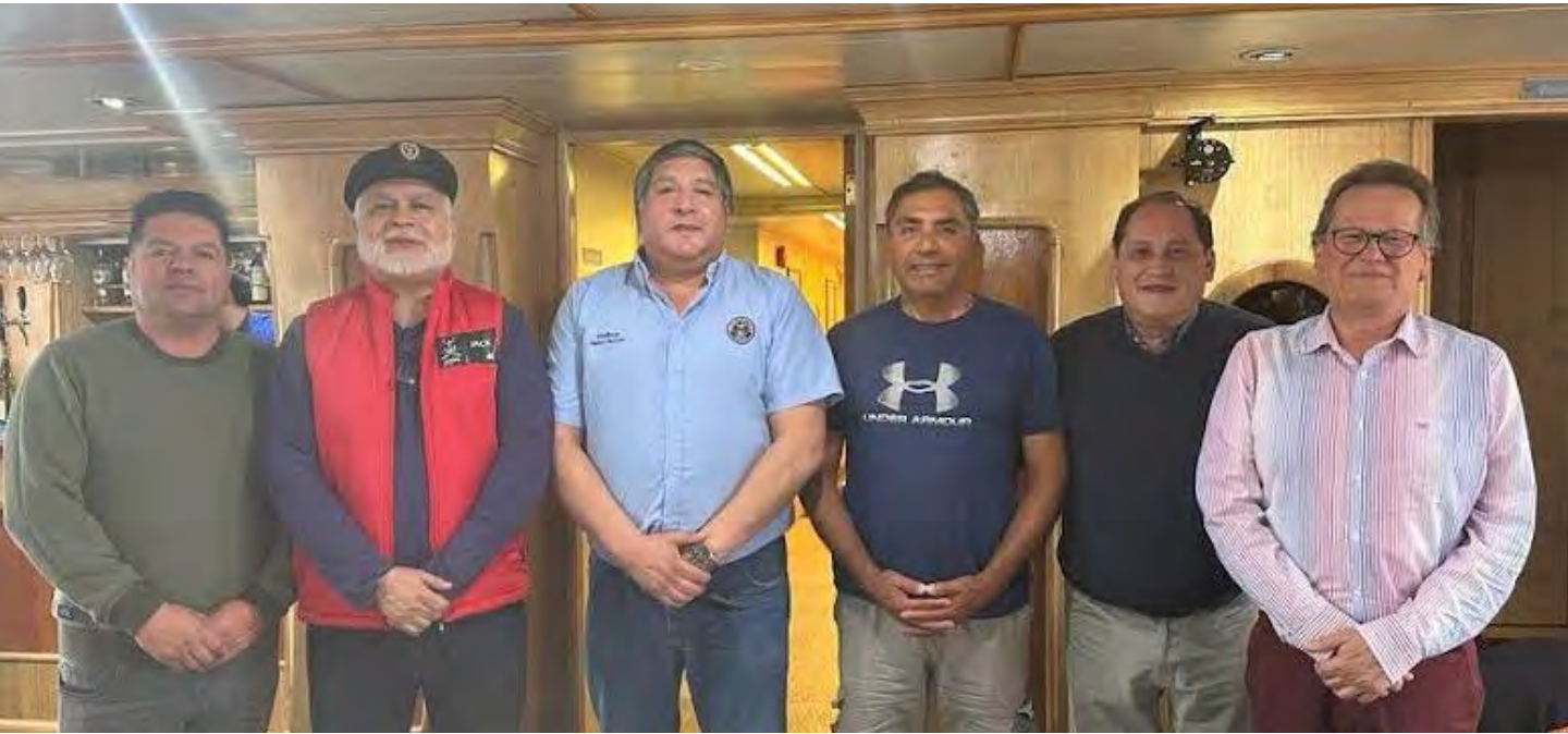
Hermanos BELLACO, Capitán de la Nao Quintero, JACK, Capitán de la Nao Santiago, SIMBAD, Capitán Nacional de la Hermandad de la Costa de Chile, LAPA, Capitán de la Nao Iquique, ESTURIÓN, Capitán de la Nao Copiapó Caldera, y SOBREGIRO, Capitán de la Nao Puerto Montt.